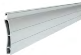
PE 41 wysokość profilu: 41mm grubość: 8,5mm