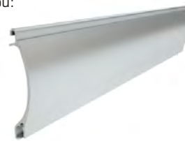
PEKP 52 wysokość profilu: 52mm grubość: 13mm