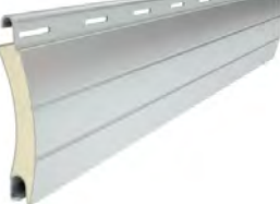
PA 55 wysokość profilu: 55mm grubość: 14mm