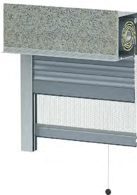
SP + MKT