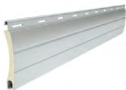
PA 45 wysokość profilu: 45mm grubość: 9mm