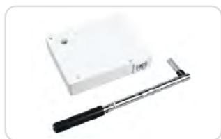
Kasety z przekładnią na linkę lub pasek