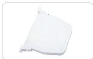
Zwijacze na linkę lub pasek