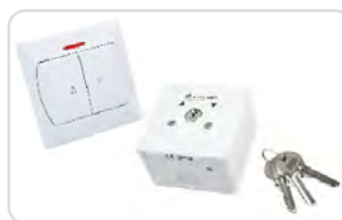
Przełączniki klawiszowe i kluczykowe