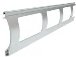
PEK 52 wysokość profilu: 52mm grubość: 13mm