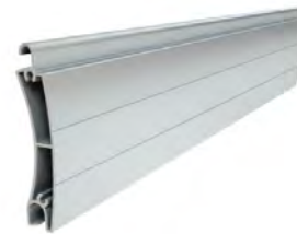
PE 55 wysokość profilu: 55mm grubość: 14mm