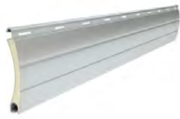
PA 39 wysokość profilu: 39mm grubość: 9mm