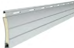
PA 40 wysokość profilu: 40mm grubość: 8,7mm